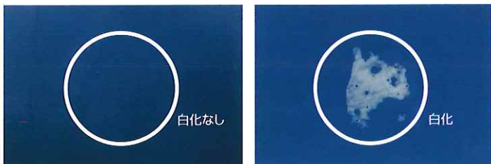
※アルコール滴下30分経過後