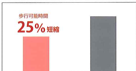
※気温 28℃、湿度 58%