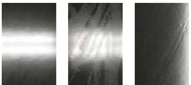
クイックスター (正常皮膜)